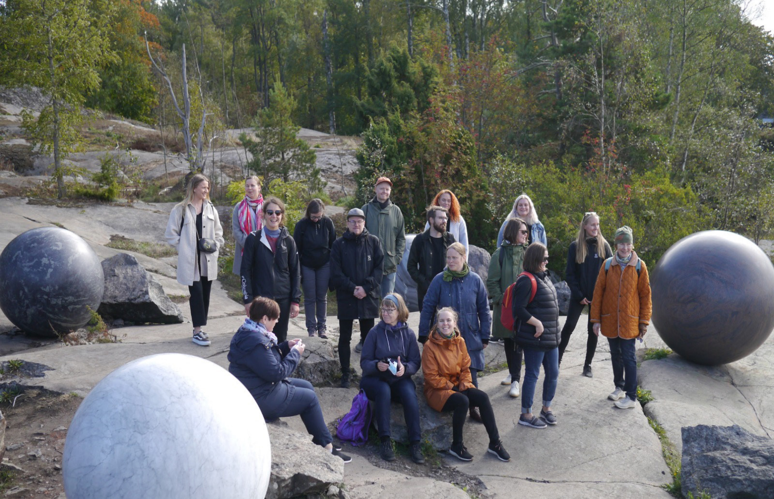
Museoliiton henkilökunta kokoontui viettämään syyskuussa virkistyspäivää Helsinki Biennaaliin.

Suomen museoliiton palveluksessa olivat vuoden aikana: