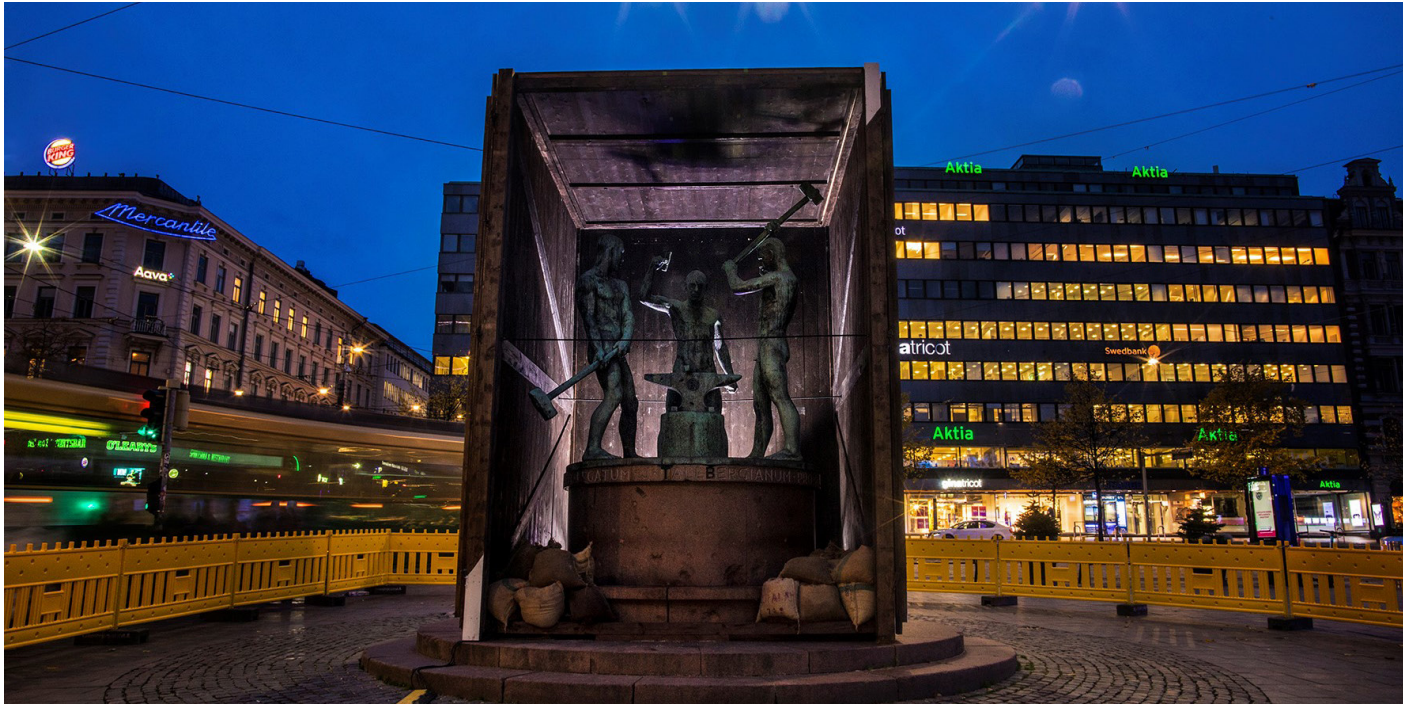
Vuoden viestintäteko -palkinto myönnettiin Mieliä - Helsinki 1939–1945 -näyttelyn markkinoinnille.

”HAMin ja Helsingin kaupunginmuseon ensimmäisen yhteisen näyttelyn markkinointi toimii erinomaisena esimerkkinä onnistuneesta näyttelyviestinnästä, joka jalkautuu museon seinien ulkopuolelle. Mieliä - Helsinki 1939–1945 -näyttelyn markkinointi onnistui tavoittamaan myös yleisöä, joka ei lähtökohtaisesti ole kiinnostunut museoista. Kampanja herätti kysymään: Mitä täällä tapahtuu? Perinteisten markkinointikanavien lisäksi kampanjaan kuului tempauksia, joissa museot ottivat haltuun kaupunkikuvan yllättävällä ja innovatiivisella tavalla.”