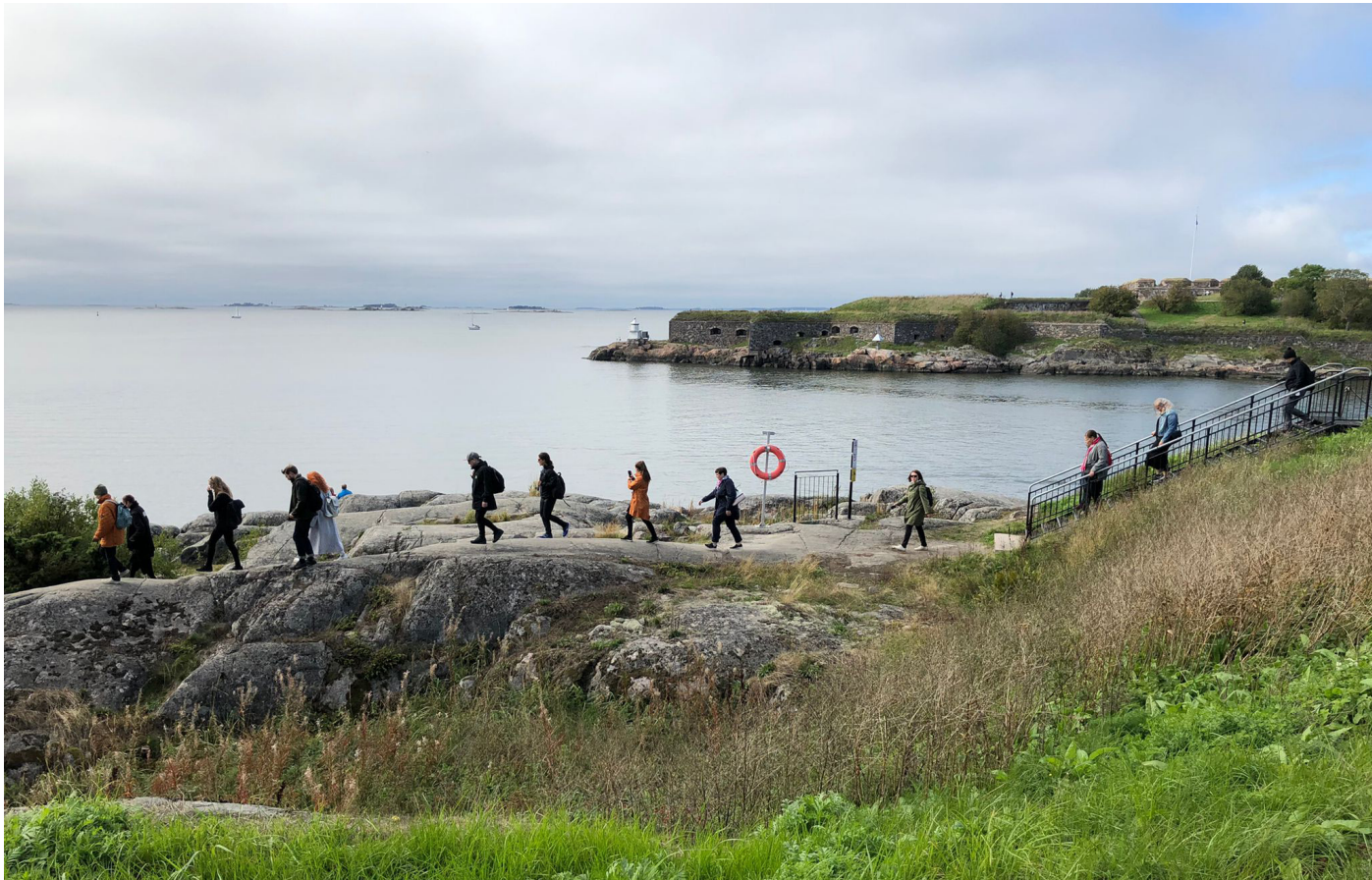
Museiförbundets personal besökte Helsingforsbiennalen.