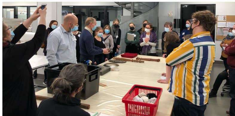
Esinetuntemus museoissa -koulutus järjestettiin marraskuussa Metropolitan Arabian Kampuksella turvallisuusohjeita noudattaen.