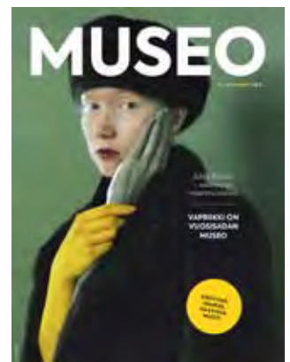
MUSEO-lehden kannet, 3 ja 4.