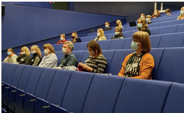
Näyttelyfoorumi järjestettiin marraskuussa Kotkassa Merikeskus Vellamossa turvallisuusohjeita noudattaen.