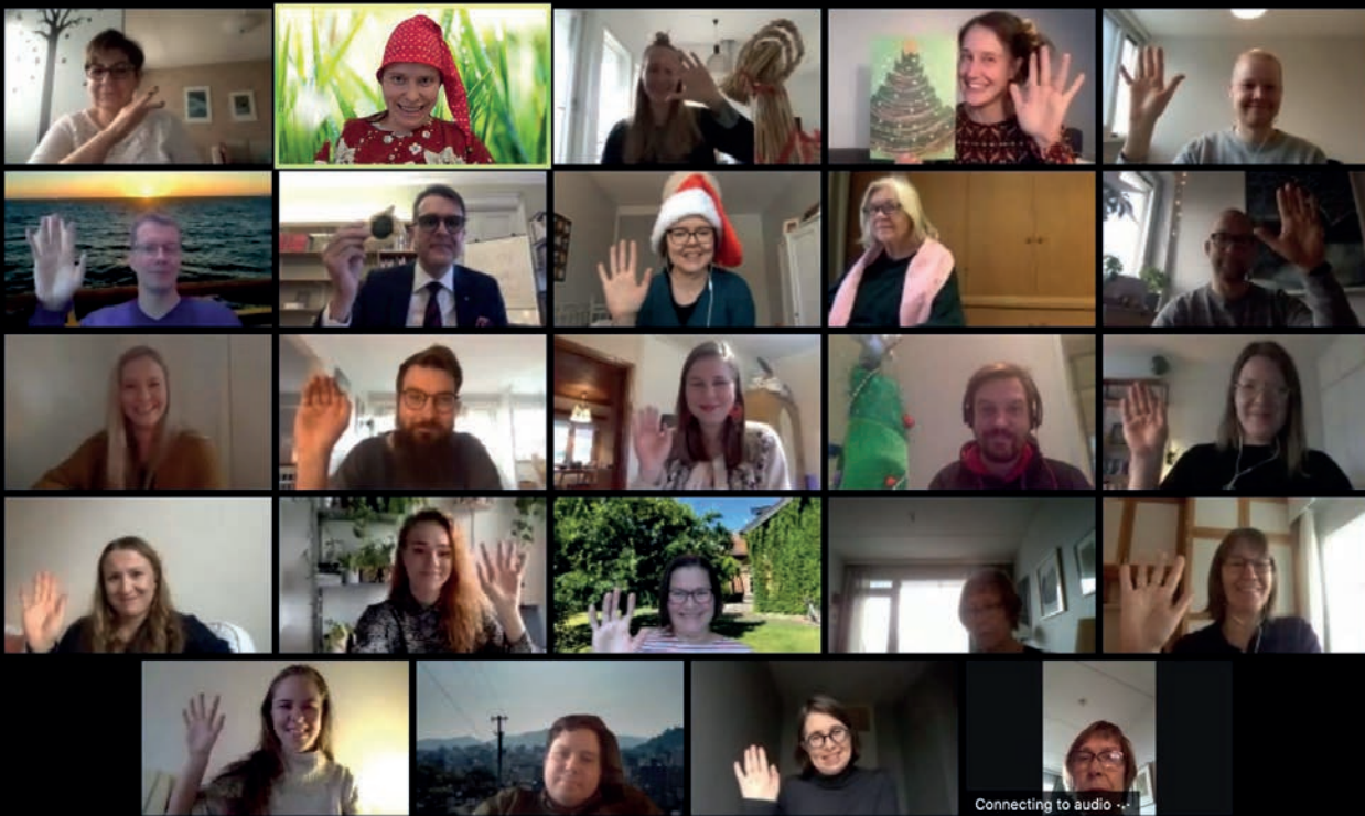
Koronaviruspandemian takia Suomen museoliiton henkilökunta työskenteli pääosin etänä maaliskuusta 2020 lähtien. Kuvassa vietetään henkilökunnan etäpikkujouluja.

toimintasuunnitelma. Museoliiton ja FMAC:n työsuojeluvaltuutetut tekivät syksyllä henkilökunnan työhyvinvointikyselyn, jonka tuloksia käytiin läpi koko henkilökunnan kanssa. Osa kysymyksistä käsitteli etätöy ja koronatilanteen vaikutuksia työhyvinvointiin.