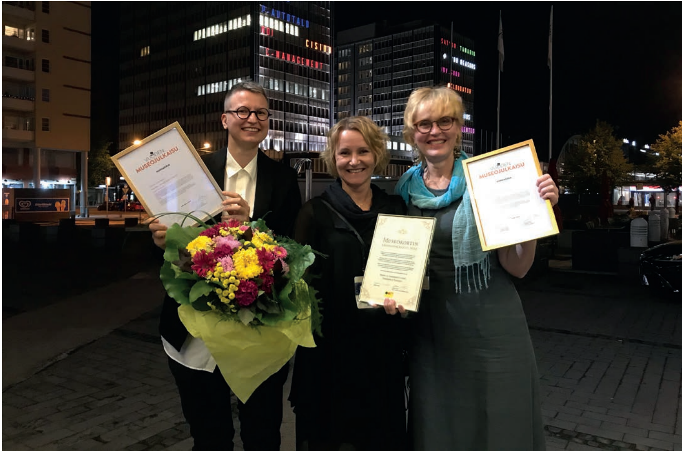
Museokeskus Vapriikin ja Maahenki-kustantamon teos Pellavaliina – Tampellan damasti 1859-1977 palkittiin Vuoden museojulkaisuna 2020 Valtakunnallisilla museopäivillä. Museokortin erikoispalkinnon sai Tiedekeskus Tietomaa.